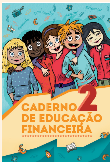
Catálogo 3832 - 4,90 €