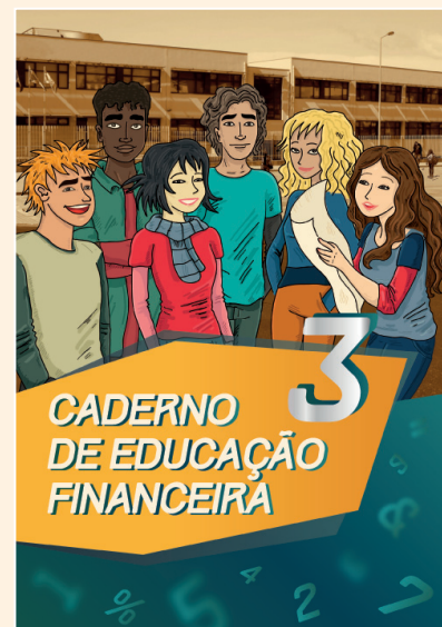
Catálogo 3833 - 4,90 €