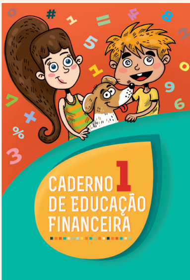
Catálogo 3831 - 4,90 €